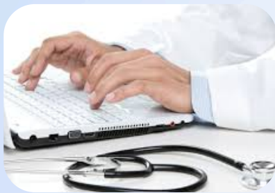
Gestão Clínica/ Consultoria