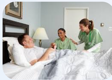
Hospices/Clínicas de Transição